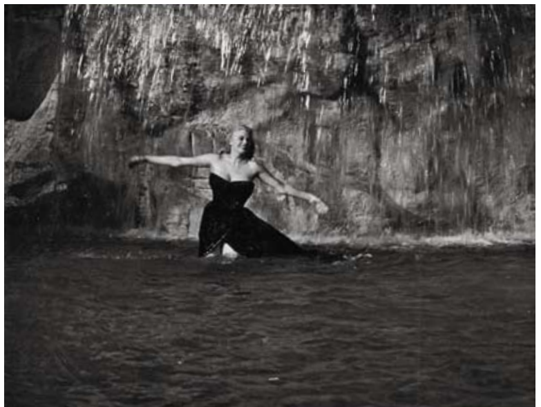
Photo prise lors du tournage de La Dolce Vita , 1959.