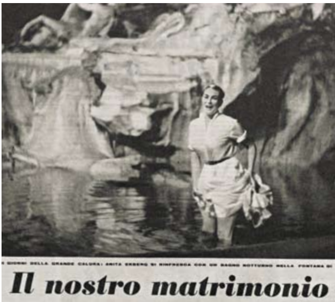
Anita Ekberg dans la fontaine de Trevi. Extrait du Tempo Illustrato , septembre 1958.